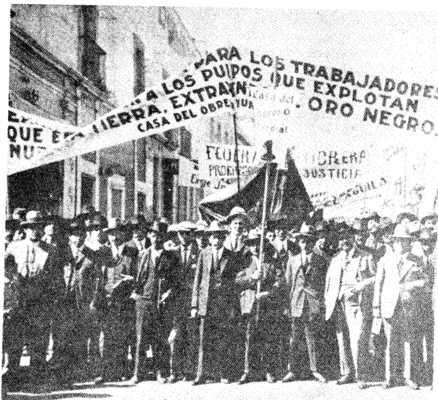
Manifestación de trabajadores adheridos a la Casa del Obrero Mundial en 1915. (Del libro Obreros somos... ).

Definitivamente, yo creo que necesitamos nuevas formas de organización política. Creo que hay muchísimo que podemos aprender de la experiencia del Partido Comunista, en especial durante la que para mí es su mejor época, el clímax del Frente Popular. 12 Con todo y la debilidad de esa época, la presencia del partido en medio de la vida cotidiana de tanta gente, su sentido de compromiso total en la lucha y de la necesidad de aseveraciones políticas realistas, significa que hay muchísimo que aprender, y que no sólo hay que evitar los errores. También resulta muy difícil imaginar cualquier