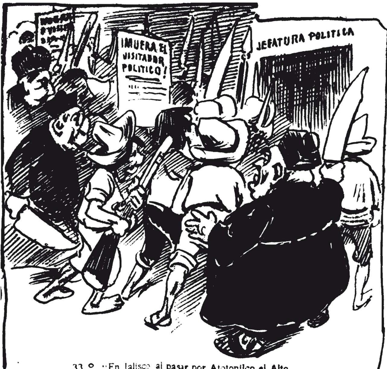
33. ° "En Jalisco al pasar por Atotonilco el Alto, se convenció de que los frailes prestan su ayuda para guardar el orden público."