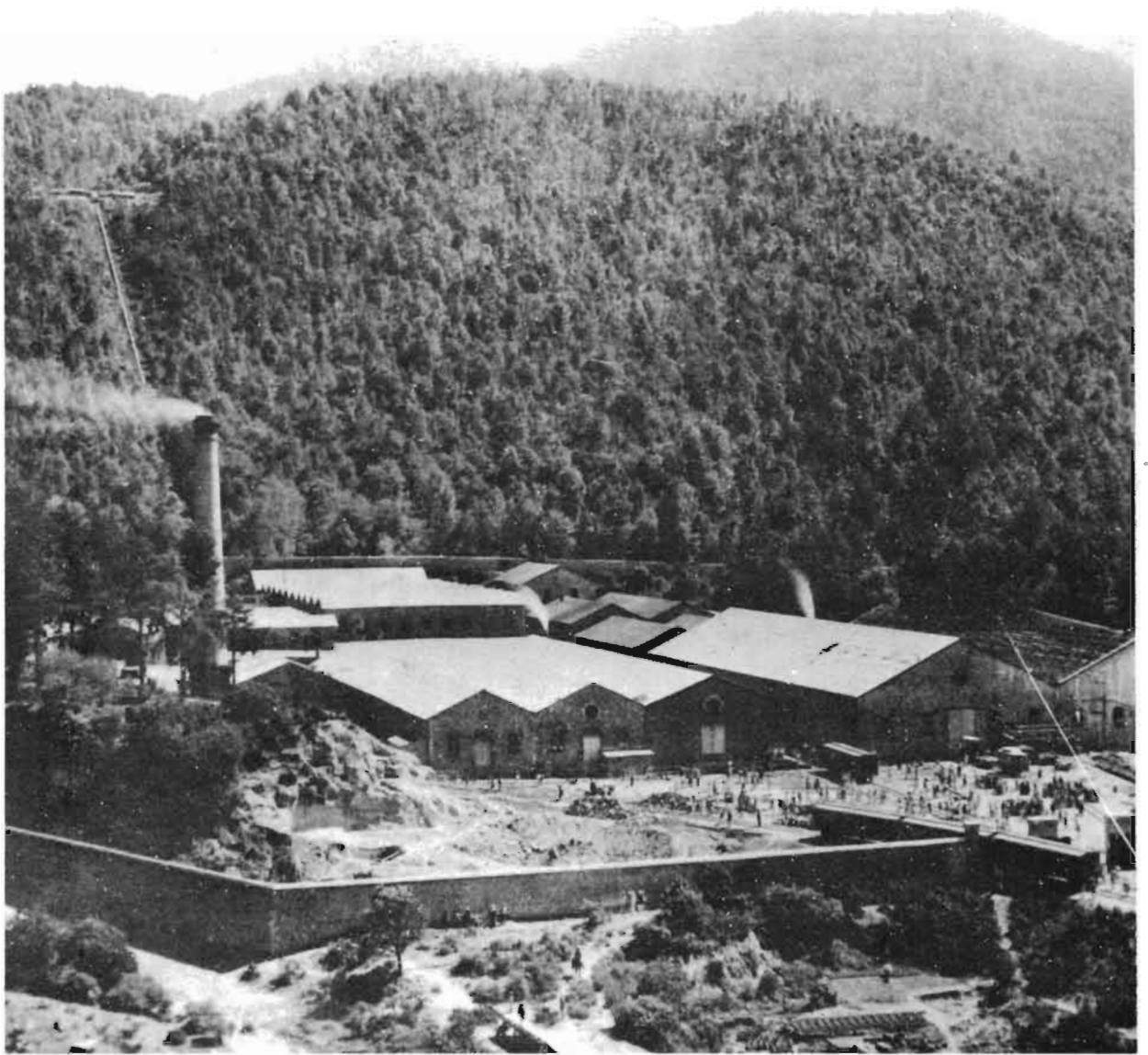
La industria papelera moderna nació en 1889 con la Fábrica San Rafael, construida en las cercanías del Ixtlaccíhuatl.