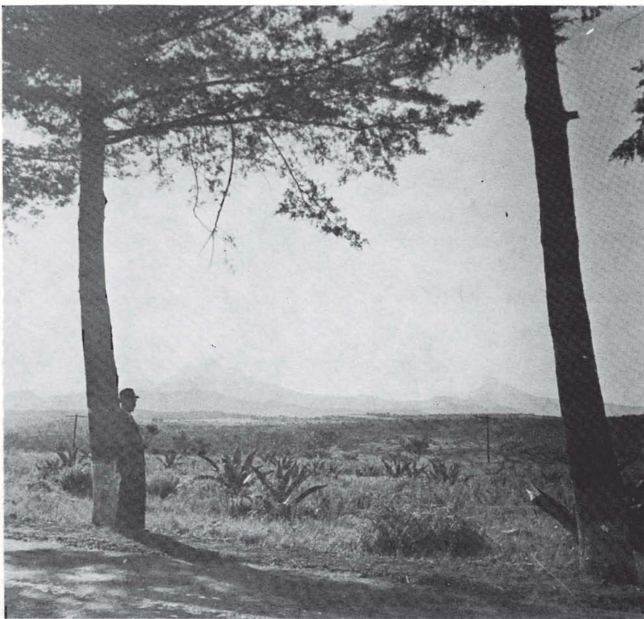
Vista de los volcanes.