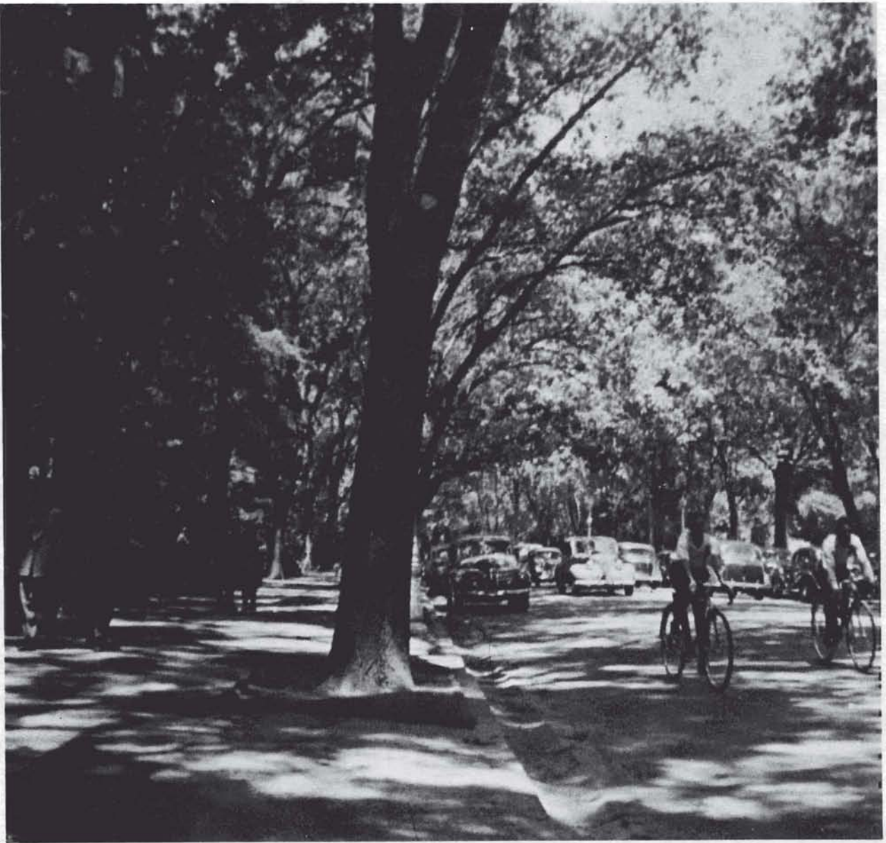
Paseo en el Bosque de Chapultepec.