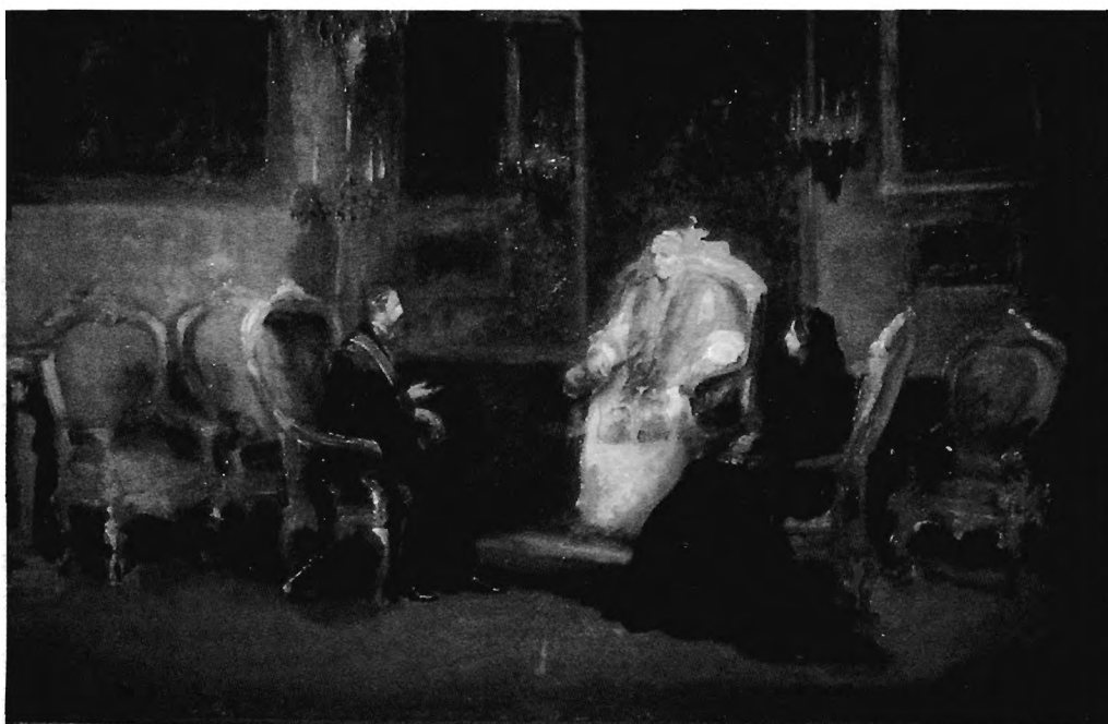
25. José Salomé Pina (1830-1909), La visita de Maximiliano y Carlota al Papa , 1866, óleo sobre tela, Museo Nacional de Historia, INAH.