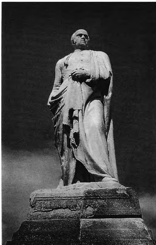
6. Antonio Piatti, José Ma. Morelos , 1864, escultura en mármol, Delegación Venustiano Carranza, D.F.