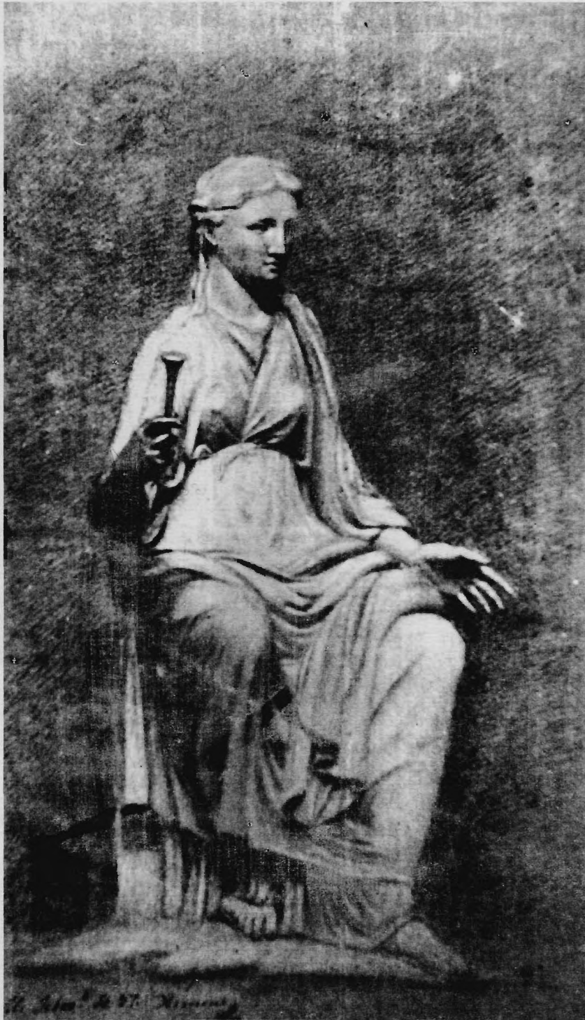
José Luciano Castañeda, La Musa Clío , ca. 1797, grafito y pigmento sobre papel, 51.3 x 36.3 cm.