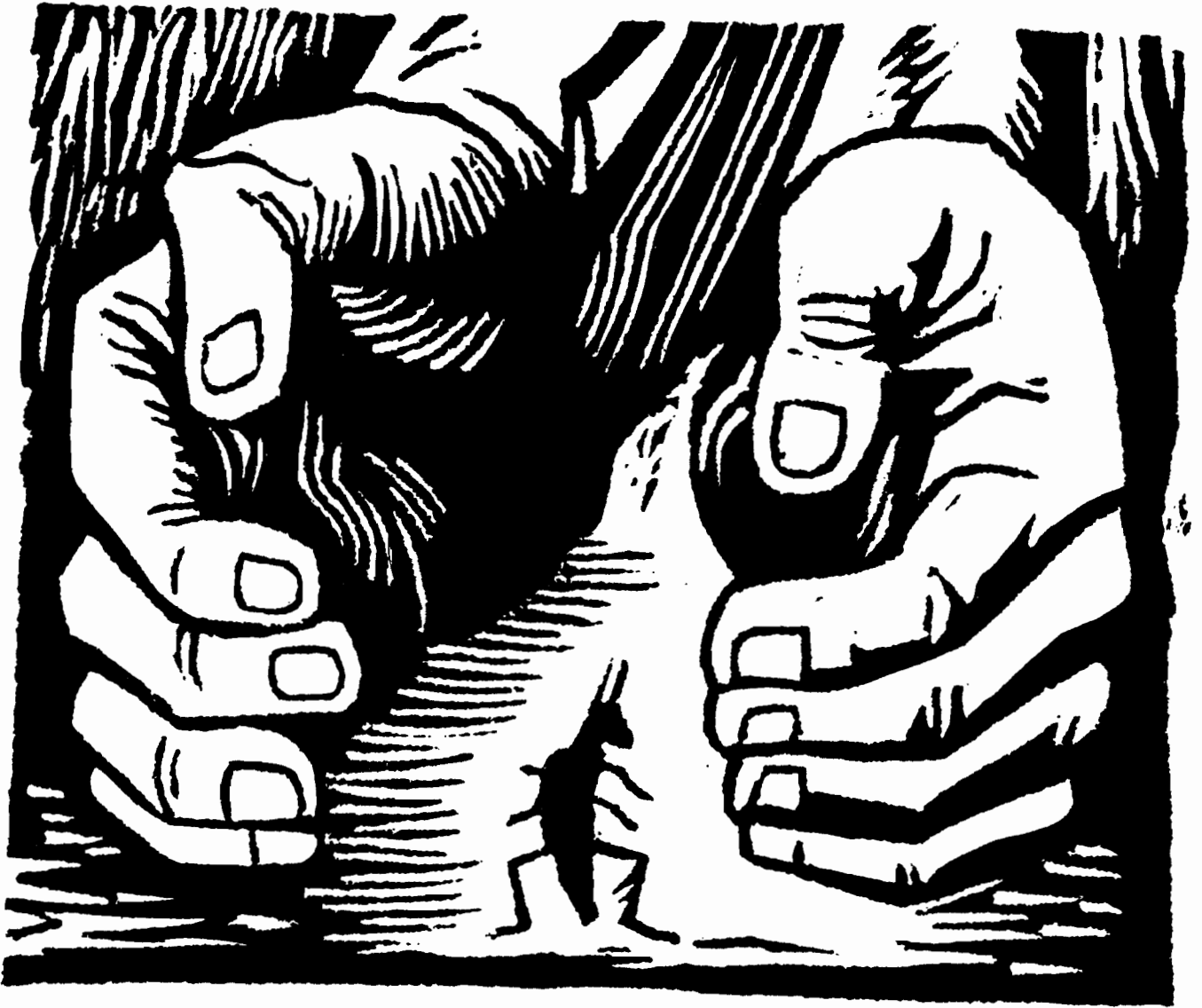
Alberto Beltrán, La casa del grillo , xilografía, 1945. Colección "Lunes".