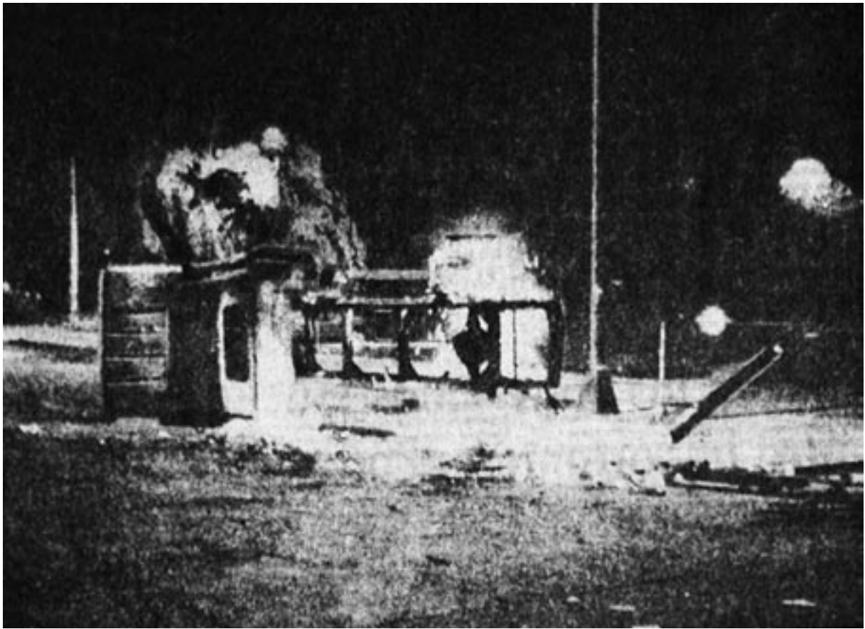
Figura 13. “Casi totalmente destruido quedó este camión de redilas que fue incendiado por los estudiantes técnicos en las cercanías del Casco de Santo Tomás. Antes, volcaron el vehículo”. ( Excélsior , 24 de septiembre de 1968. Archivo Histórico CESU, UNAM).