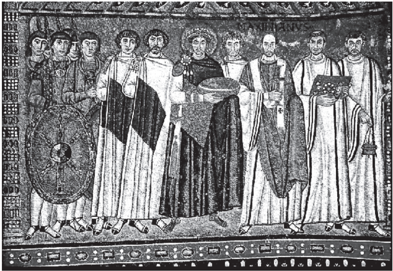
Figura 12. Reproducción del mosaico de la iglesia de San Vital, Rávena, Italia.