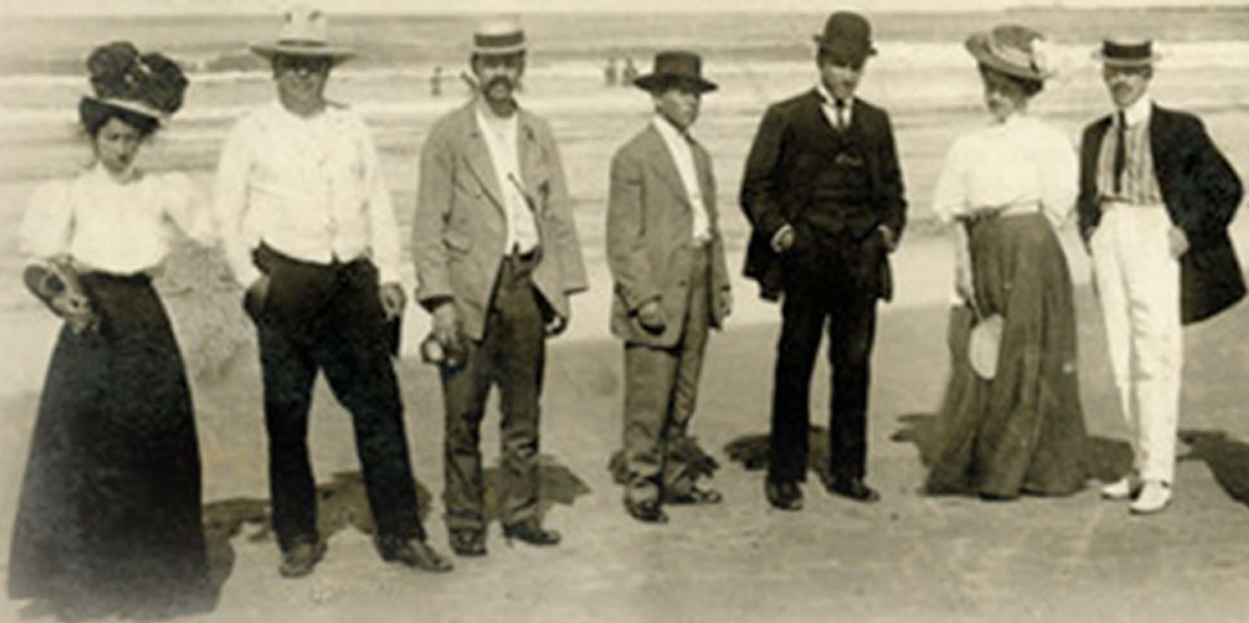
Grupo de excursionistas en la playa, ca. 1900. México. Fotografía: Mediateca INAH / SC. INAH. SINAFO. FN. MX. Col. Felipe Teixidor, Inv. 428114